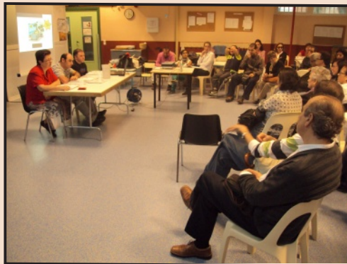
Charla Sobre Derechos de las Personas con Discapacidad

En un tono ameno y didáctico, se fueron desgranando algunas situaciones de la vida diaria, pidiendo a los asistentes que se pusieran "en la piel" de sus familiares con discapacidad, para valorar en qué medida son respetados sus derechos cotidianamente.