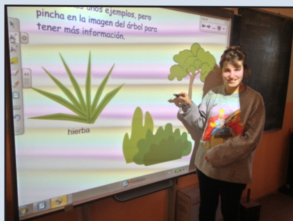
Usuaría del CEE usando la Pizarra Digital

Desde Fundación Ademo agradecemos enormemente a Simave esta donación que facilitará los aprendizajes de los alumnos del Colegio de Educación Especial.