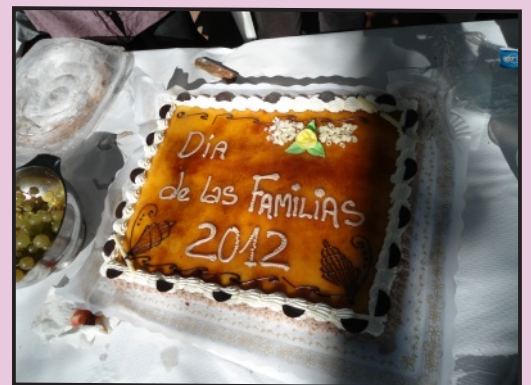
Tarta de postre para el Día de las Familias

Para mí, personalmente como profesional, el día de las familias no es solo un día donde se reúnen para comer, verse y compartir cosas, es un día donde los asistentes, comprueban como su familiar puede disfrutar de una vivienda digna y adecuada a sus necesidades. Creo que todo el mundo debería tener esas oportunidades y experiencias en la vida.