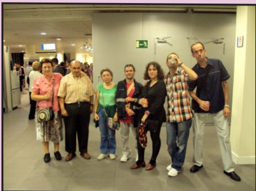
Usuarios en el estreno de "Decididos"

El martes 9 de octubre, un grupo de 7 personas del Centro Ocupacional I, fuimos en metro hasta Ventilla, para ver el estreno del documental "Decididos".