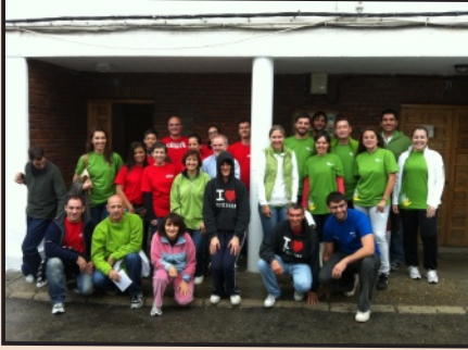
Voluntarios, Profesionales y Usuarios en las Viviendas

Así el día 5 de octubre, 14 voluntarios de Fundación Telefónica , acudieron al Centro Ocupacional I de Arganda , donde plantaron árboles junto con los usuarios y profesionales. La actividad estaba enmarcada dentro