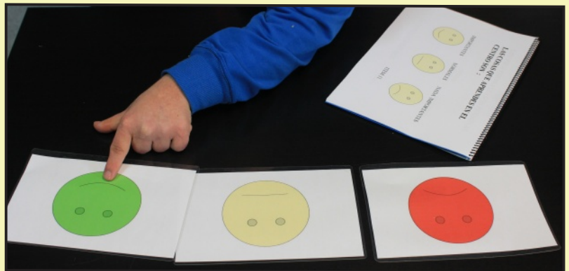
Realización del cuestionario por un Usuarios