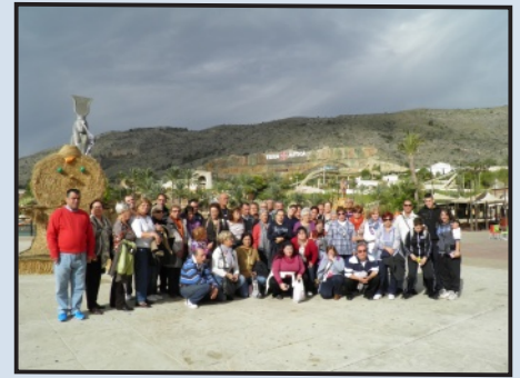
Usuarios y Familiares en Benidorm

Voy a contaros la primera noche según mi experiencia. Fue la más emotiva como seres humanos, como ya os dije al principio todos eran ingleses, un ambiente muy frío y distante, según iba avanzando la noche fuimos animándonos gracias a algunas marchosas que se disfrazaron y a la marcha que tienen nuestros hijos y muchos de nosotros. Nos hicimos con todo el personal que en esos momentos había en la sala, tengo que reconocer que los ingleses no son tan fríos como parece, cantaron y bailaron junto a nosotros en un ambiente festivo lleno de armonía y felicidad. El hotel hizo un karaoke, los chicos subieron al escenario y todos cantamos la famosa canción "Cielito Lindo", el coro era todos los que se encontraban en la sala, el hotel regaló unas gorras a los chicos. Hay que reseñar que los ingleses nos dieron una lección de hermandad, nos dieron una despedida digna para no olvidar.