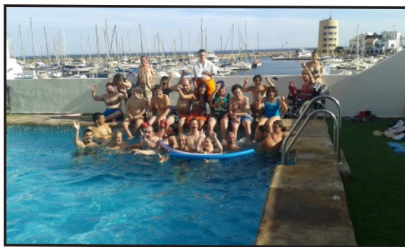
Piscina del Hotel de Aguadulce

Del 18 al 24 de julio, 24 participantes adultos, acompañados de 6 monitores han disfrutado de unas merecidas vacaciones en Aguadulce-Mar de Alborán en el sur de Almería, donde han podido desconectar del día a día, hacer excursiones y sobre todo bañarse mucho en unas estupendas playas adaptadas.