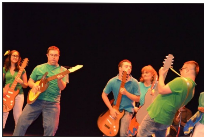
Grupo de Baile de Salón Los Girasoles

El 4 de junio, el Servicio de Ocio de la Fundación ADEMO celebró con gran éxito, su VII Festival Artístico Solidario en el Auditorio Monserrat Caballé de Arganda del Rey. Más de 300 espectadores llenaron el auditorio y disfrutaron de las actuaciones de los 40 artistas que componen los distintos grupos de baile del programa cultural.