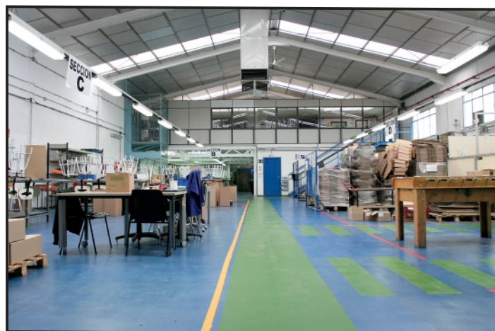
Interior CO I "Arganda"

Esta solera para la pista deportiva junto con una rampa de salida del centro a la zona deportiva, pudo construirse el verano de 2013 gracias a la ayuda recibida por el BBVA en la II edición de su convocatoria Territorios Solidarios por la que se obtuvieron 10.000€