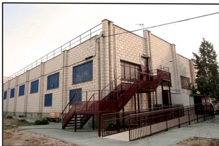
Exterior CO I "Arganda"

Entre 2012 y 2013, se invirtieron 18.000 € del PIR en la adecuación de toda la zona exterior del Centro Ocupacional. Así se valló todo el terreno, se creó un acceso exterior con una cochera, se construyó una acera en todo el perímetro y se cambió de ubicación la escalera de incendios para aprovechar mejor el espacio y poder construir una pista deportiva.