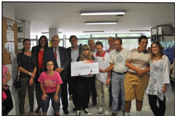
Entrega del Cheque del Instituto de Ingeniería del Conocimiento

Gracias al Instituto de Ingeniería del Conocimiento (IIC) y a la empresa de Seguros de “El Corte Inglés” que han realizado donaciones de 14.378€ y 2.237€ respectivamente, el proyecto Ariadna sigue creciendo y con ello llevando a cabo más acciones de empleo con Apoyo desarrolladas en los Centros Ocupacionales de la Fundación Ademo.