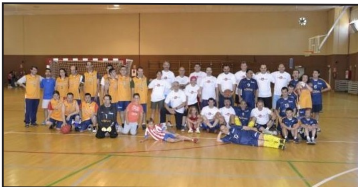
Foto de Familia de la I Jornada Deportiva de Integración

El Domingo día 8 de Junio el Servicio de Ocio y Deporte de la Fundación ADEMO celebro su I Jornada de la integración deportiva en el Polideportivo Municipal de Moratalaz, acudieron unas 200 personas y pudimos disfrutar de numerosas actividades, así como un partidillo de futbol entre niños de la escuela de futbol sala del colegio Ademo con el equipo del CDF de Moratalaz.