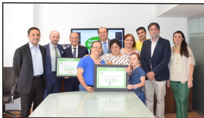
Entrega del Cheque de Seguros el Corte Inglés

Los actos de entrega de las donaciones se llevaron a cabo el 29 de Julio en las oficinas de Seguros El Corte Inglés y el 11 de Septiembre en el Centro Ocupacional Il Pablo Sacristán, donde los profesionales del Instituto de Ingeniería del Conocimiento se acercaron y pudieron ver los trabajos que allí se realizan.