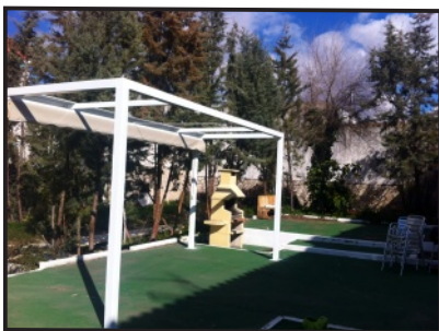
Nuevo patio de Viviendas.

En el servicio de Viviendas Tuteladas trabajamos con el propósito de generar un espacio de convivencia "familiar" en el que ofrecer apoyos a cada una de las personas que residen en las