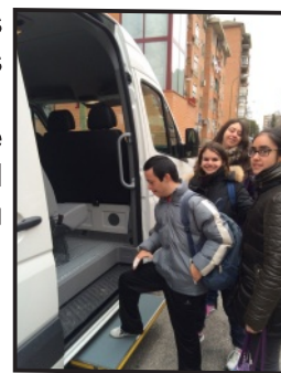
Usuarios usando la Furgoneta

- Conseguir que las personas con discapacidad intelectual con más problemas de movilidad y/o en claro proceso de envejecimiento, participen en actividades comunitarias, externas al Centro Ocupacional.