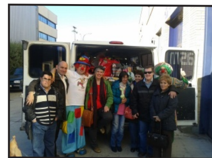
Usuario y Voluntarios frente a la furgoneta

Animaciones, Escuela de Baile D.Vega, Bimbo y a Colimser S.L.