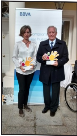
Entrega de premios

Dos proyectos de la Fundación ADEMO resultaron ganadores en la 3ª Convocatoria de Ayudas "Territorios Solidarios" del BBVA . Esta convocatoria surge con la finalidad de colaborar con las entidades no lucrativas que tienen más incidencia a nivel local y regional, para conseguir un futuro mejor para las personas, para lo cual el BBVA destina 1,65 millones de euros.