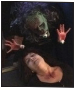
Profesionales en la F. de H.

Un año más en el colegio se celebró Halloween , una de las mejores fiestas que se celebran durante el curso escolar.