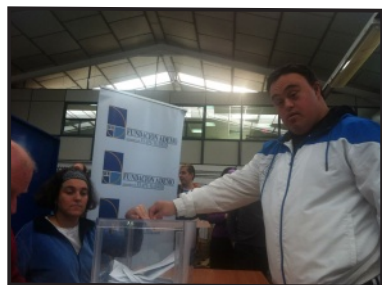
Usuarios F. ADEMO el día de las elecciones

El martes 25 de noviembre de 2014 se celebraron las I Elecciones a Representantes de las personas con discapacidad intelectual usuarias de la Fundación ADEMO .