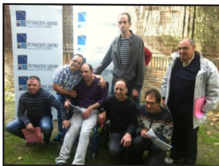
Representantes de la Fundación ADEMO

Con esta votación y con la elección de los 5 representantes de la Fundación concluye un proceso laborioso de 4 meses, donde además se eligieron los 16 representantes internos de la mayoría de Servicios de la Fundación (6 en C.O I, 4 en C.O II, 3 en Ocio, 2 en Colegio y 1 en Viviendas). Destacamos el enorme interés suscitado entre los usuarios de la Fundación, que llevó a 40 personas a presentarse como candidatos en alguna de las elecciones.