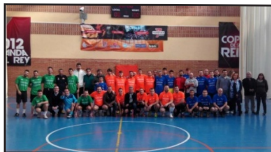
Foto de familia de los participantes