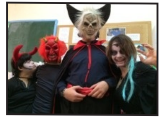
Alumnos en la fiesta de Halloween