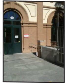
Centro CRECOVI C. de Madrid

pretende ser un centro de referencia también para profesionales, realizando actividades de formación, encuentros interprofesionales, jornadas de puertas abiertas etc.