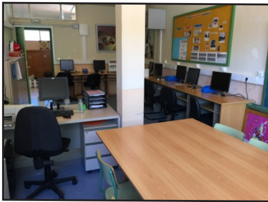
Antigua Aula de Informática.

El pasado mes de septiembre el Colegio de Educación Especial estrenó un nuevo Espacio Tecnológico , que se ha instalado en una de las aulas de Transición a la Vida Adulta. El espacio consta de 10 ordenadores táctiles MSI de gran tamaño y de una nueva instalación WIFI con un servidor web propio que mejora considerablemente el acceso a internet.