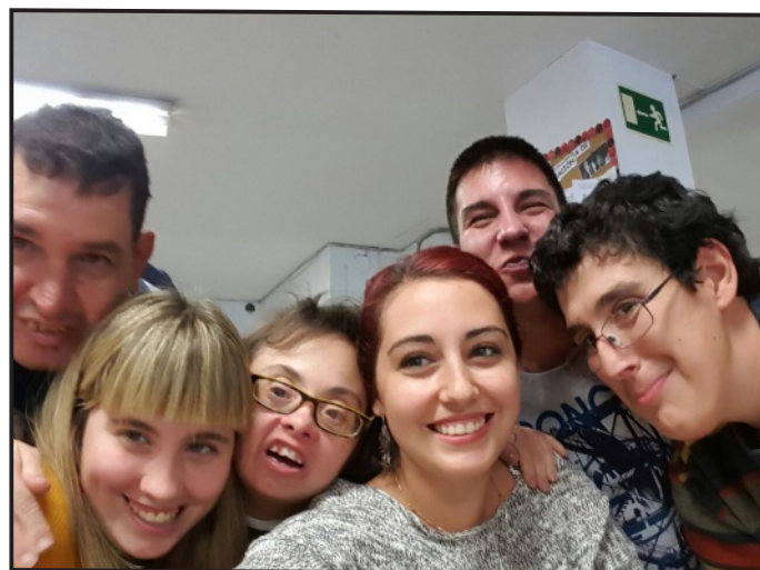
Paloma con los usuarios del Centro Ocupacional.

Lo que más me ha sorprendido ha sido el entusiasmo con el que reciben a alguien