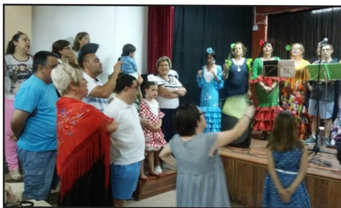
Día de las Familias en Arganda del Rey - Asociación Ademo.

Un beso enorme para todos, os esperamos el año que viene.