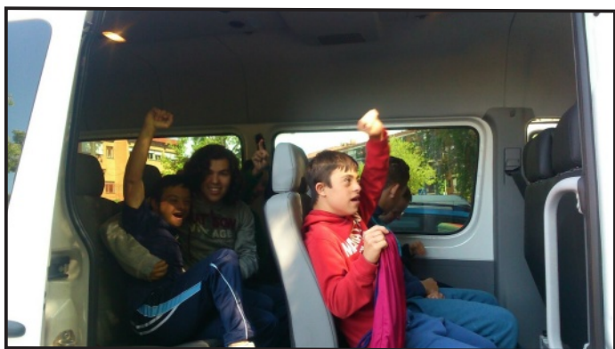
Usuarios de Fundación Ademo en la Furgoneta Nueva.

Durante todo el año 2015 se ha desarrollado en los Centros Ocupacionales el proyecto " Acortando Distancias ", que ha contado con el apoyo de la Obra Social de La Caixa y de la Fundación ONCE y con el que se ha podido adquirir un vehículo adaptado con capacidad para 9 personas y hasta 4 sillas de ruedas.