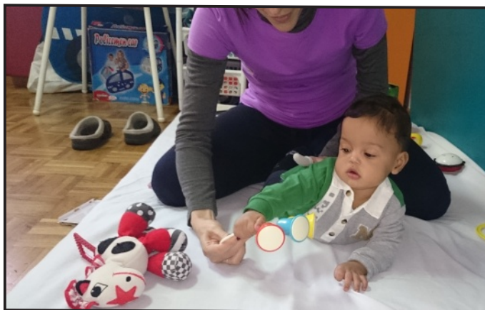
Sesión de Estimulación con D.L.

Durante todo el año 2015 en el Centro de Atención Temprana , se ha venido desarrollando el proyecto " Tratamientos Especializados ", que ha contado con la financiación de la Red Solidaria de Bankia 2014 y del BBVA a través de su convocatoria Territorios Solidarios 2014 .