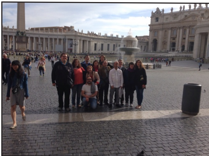
Foto de Familia en el Vaticano.