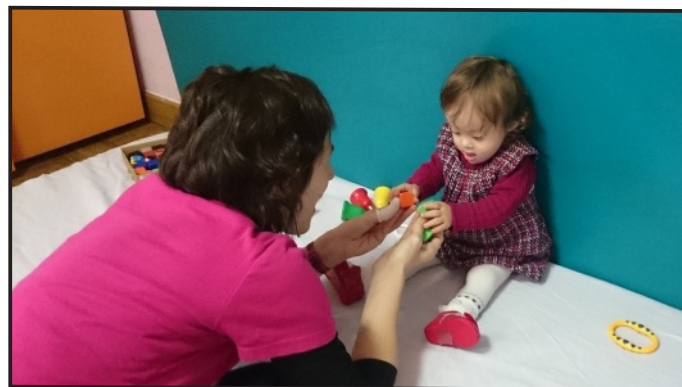
Sesión de estimulación con S.E.

Respiratoria ", " Terapia Miofuncional ", " Adaptaciones posturales en Yeso " y " Adaptaciones funcionales en el hogar ". De los que se han beneficiado 42 niños. También se han podido dar tratamientos generales (logopedia, estimulación y psicoterapia) a 8 niños que estaban en lista de espera, pero que necesitaban urgentemente estos tratamientos por lo que no podían esperar a tener plaza pública.