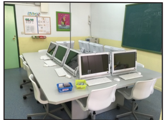
Nueva Aula de Informática.

Este nuevo espacio ha sido posible gracias a la financiación obtenida ( 9.000 € ) en la II Convocatoria de Acción Social 2014 de la Fundación Montemadrid y Bankia .