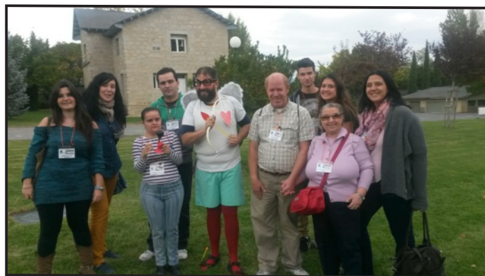
Familiares y Usuarios en el II Encuentro de hermanos en Guadarrama.

Estaban organizadas diferentes actividades lúdicas por grupos de edad en las que pudieron participar. Fue una gran oportunidad para conocer a otros niños en su misma situación, así como a otros niños con discapacidad o alteraciones en el desarrollo y compartir juegos entre todos.