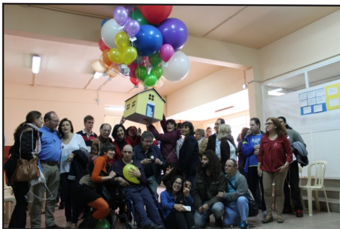
Foto de final de la Jornada.