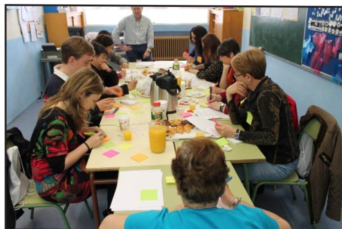
Uno de los Grupos de Trabajo.

Continuamos elaborando el I Plan Estratégico de la Fundación ADEMO . Una vez superada la fase de diagnóstico, el pasado mes de mayo realizamos la Jornada de Aportaciones de Futuro , con más de 100 asistentes. Durante todo el segundo semestre de 2015 se ha elaborado el borrador con todas esas aportaciones y esperamos que a principios del año 2016 de nuevo en otra Jornada de Trabajo quede aprobado el Plan definitivo .